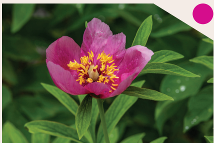
Peonia selvatica ( Paeonia officinalis )