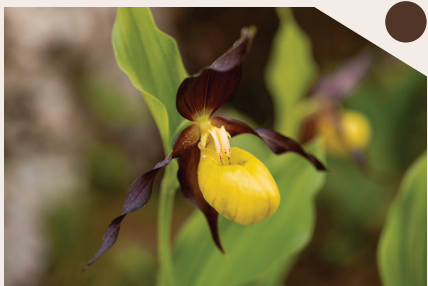
Scarpetta di Venere ( Cypripedium calceolus )