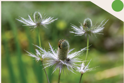
Juliana ospita circa 70 specie vegetali protette nel territorio sloveno, tra cui la Regina delle Alpi ( Eryngium alpinum ).