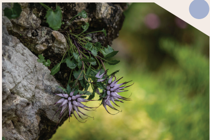
Raponzolo di roccia ( Physoplexis comosa )