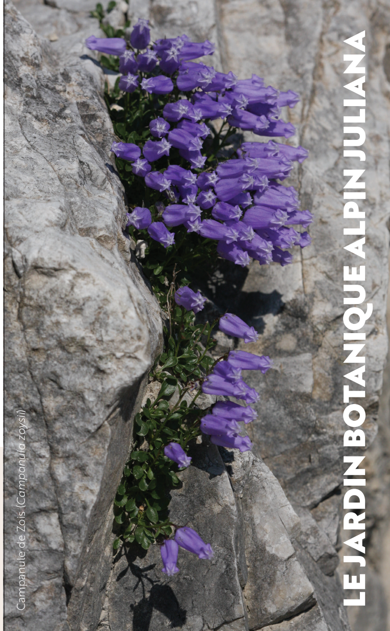
Campanule de Zois (Campanula zoysii)